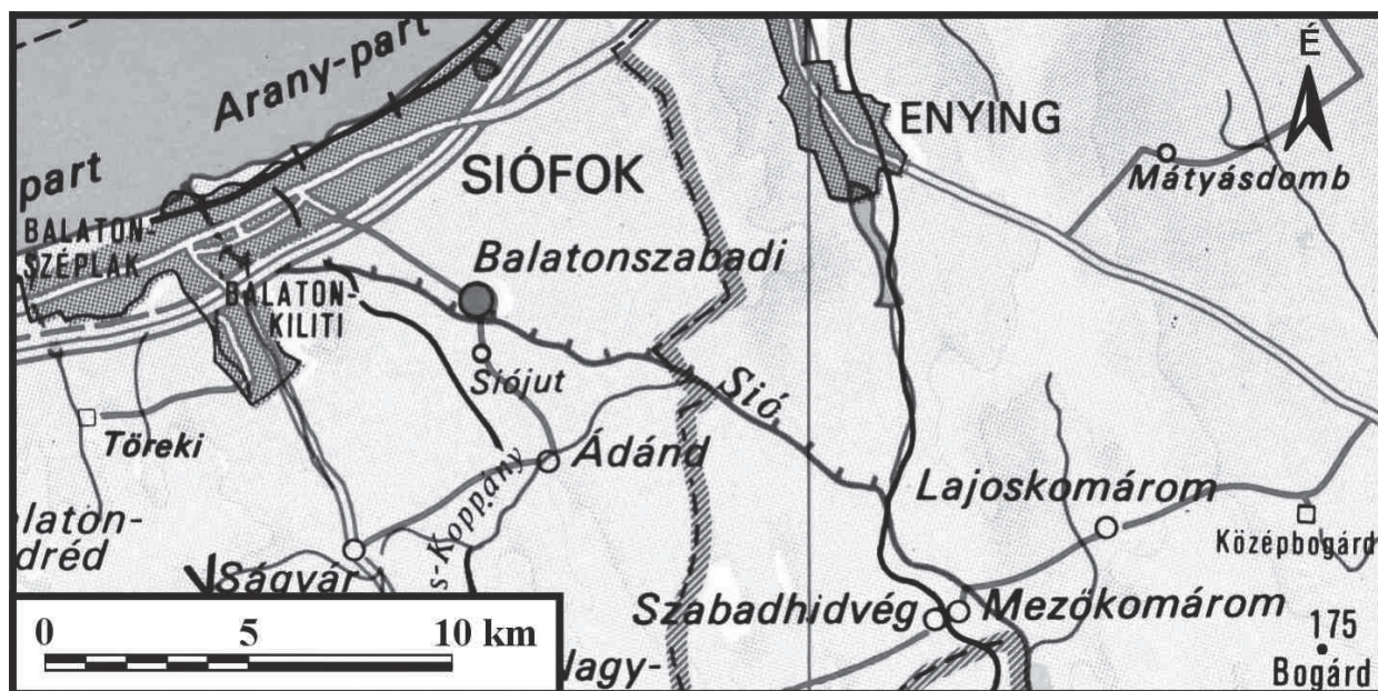
1. kép • A vizsgált terület elhelyezkedése és mai átnzeti képe

Az egyik ilyen jelenség az a tény, hogy ma is, mint feltételezhetően a középkorban, felső szakaszának legalább első néhány kilométerén nagyrészt a Balaton vize táplálja.